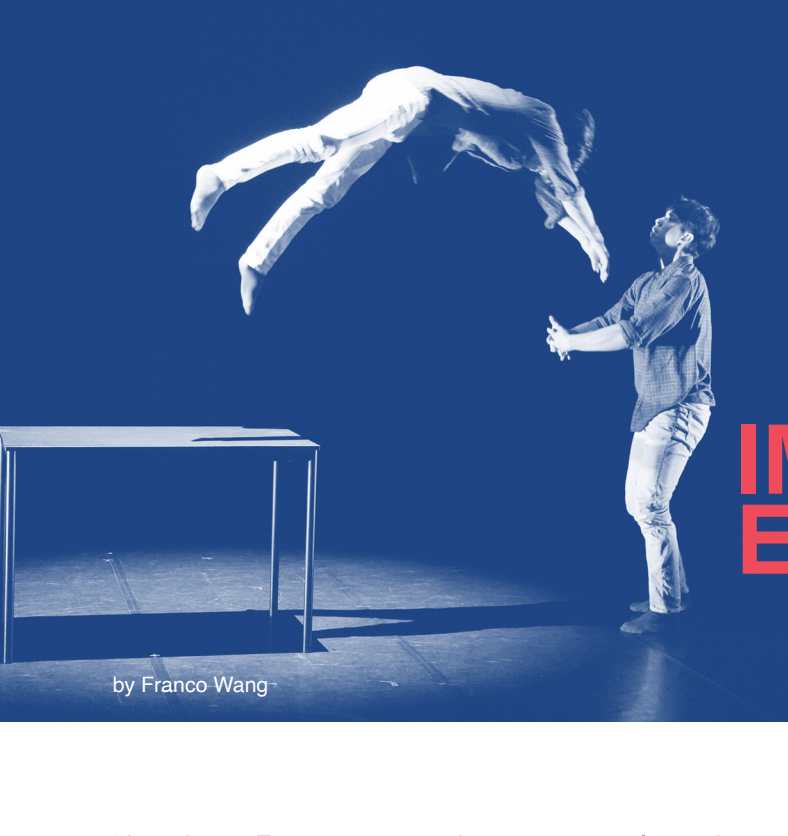
by Franco Wang