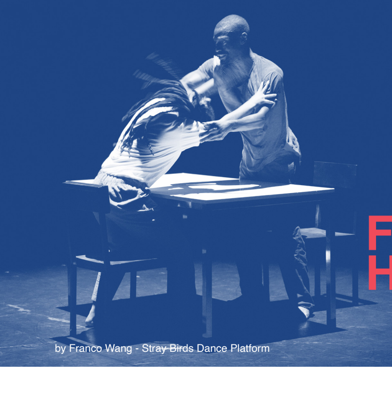
by Franco Wang - Stray-Birds Dance Platform

MASDANZA Award 2024 at Stray Birds Dance Platform Festival. Taipei, Taiwan.