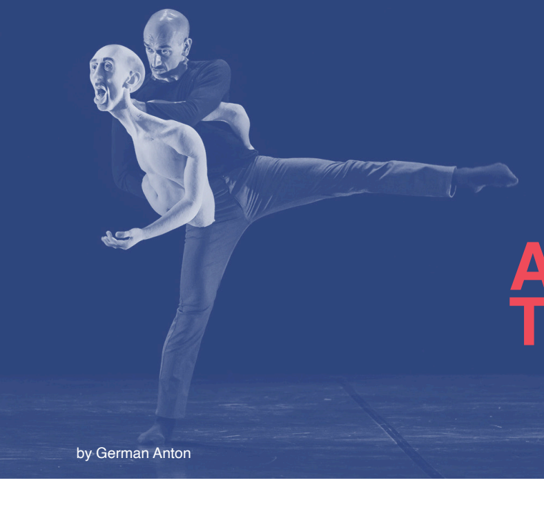
by German Anton

MASDANZA Award 2024 at Stray Birds Dance Platform Festival. Taipei, Taiwan.